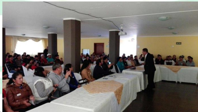
Charla de Motivación RUMBO A LA EXCELENCIA al Grupo de Jubilados del Centro de Atención al Adulto Mayor Amazonas. Club de Jardinería del IESS de la Amazonas y Naciones Unidas.